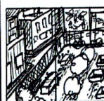
Chapitre 2: le matin Les bacs arrivent