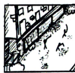
Chapitre 3: le midi On en lève les cailloux et on sème