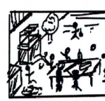
Chapitre 5: le début de soirée On récolte et on partage