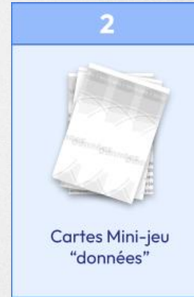
Table 3 : Coraline Lecocq et Héloïse Moulinet

Table 2 : Gaétane Bouchez et Clara Dufresnoy