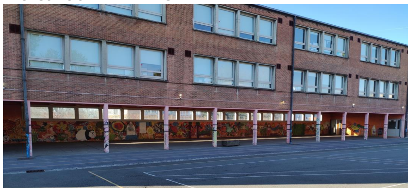
Fresque 1 : préau de l'école avec les poteaux (vue extérieure)