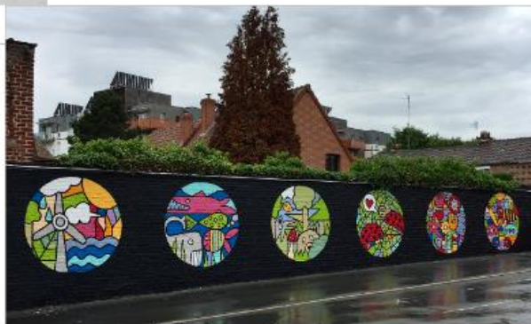
Fresque sur la biodiversité - Ecole Sainte-Anne, Croix