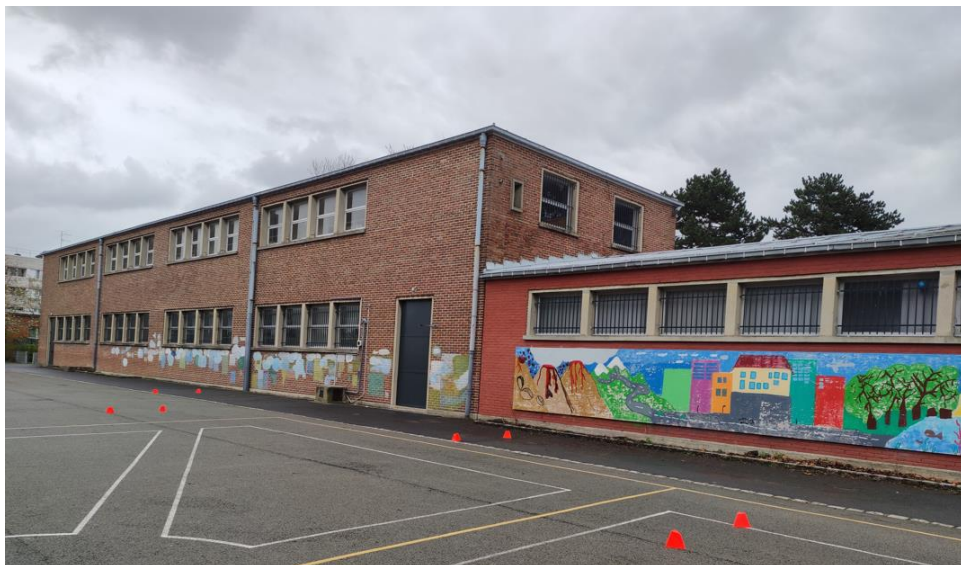
Fresque 2 : mur extérieur de la cour de l'école.