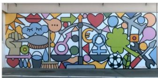
Inégalités homme/femme - Collège Lavoisier, Lambersart