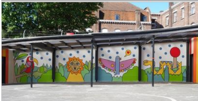
Ecole Sainte-Lucie, Tourcoing

Faire appel à un artiste local pour réaliser des fresques vivantes et colorées