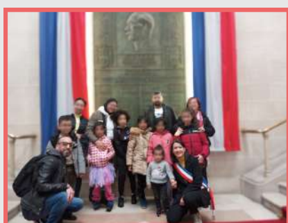
Découverte de l'Hôtel de Ville de Roubaix par des familles accompagnées dans le cadre du SAS

Par ailleurs, le SAS permet aux familles accompagnées de participer à des visites des structures municipales comme l'Hôtel de Ville ou encore la médiathèque de Roubaix qui leur a permis de connaître l'offre proposée par la médiathèque (emprunt d'ouvrages, programmation culturelle...) et d'assister à une lecture de contes. La visite a également permis à toutes les familles de souscrire à un abonnement à la médiathèque."