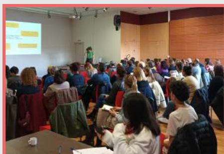
Conférence "Compétences psychosociales et bien-être à l'école" au collège JB Lebas le 23 février 2024