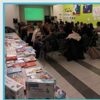
Conférence "Compétences psychosociales et bien-être à l'école" au collège A Frank le 23 février 2024

Plusieurs études démontrent les effets positifs d'un programme de développement des CPS ! Elles contribuent au développement d'attitudes positives envers l'école, à l'amélioration de la réussite scolaire et du climat de classe ainsi qu'à l'épanouissement des élèves.