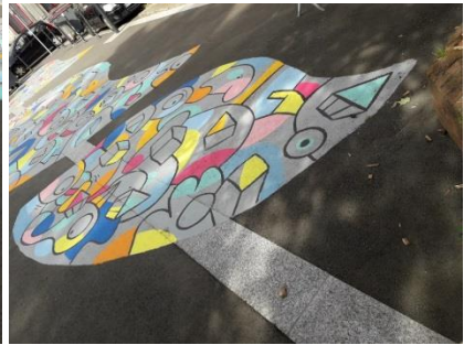
Fresque Placette Nain