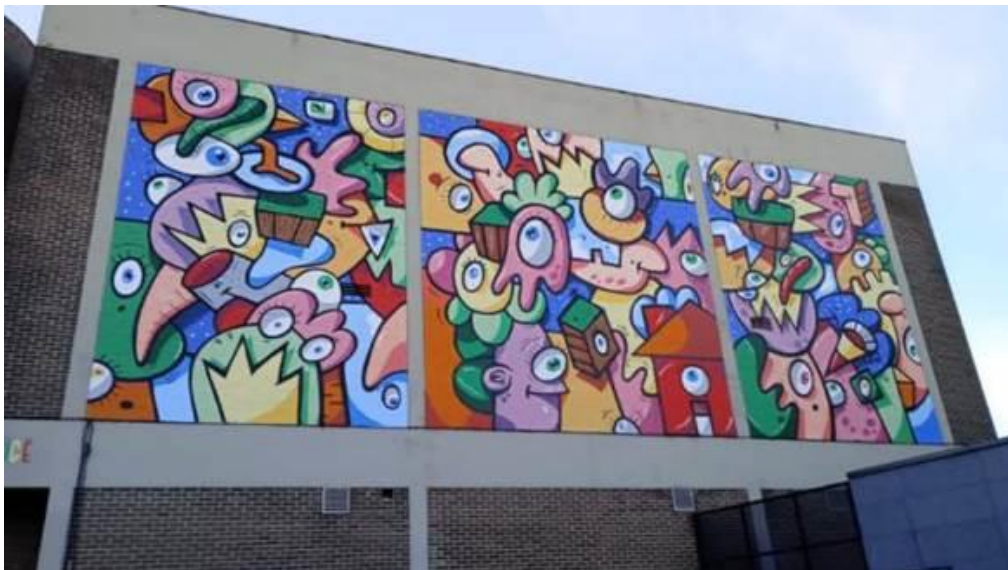
Fresque du Salle du Pays