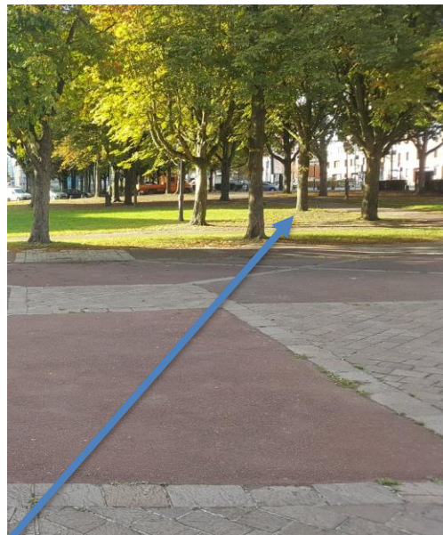
Localisation des futurs jeux